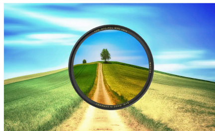
Polfilter in der Fotografie