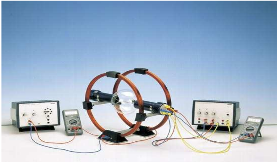
Abb. 1: Versuchsaufbau

Die beiden Netzgeräte werden in Betrieb genommen und es werden die genannten elektrischen Ströme und Spannungen erzeugt.